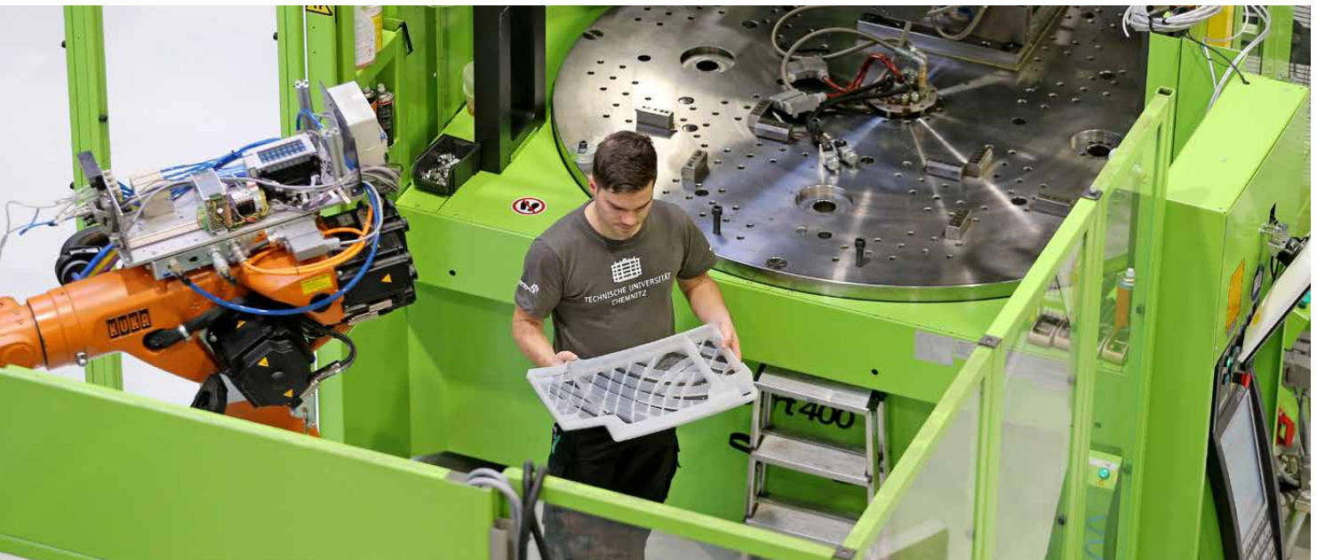
Spitzenforschung in Chemnitz: Am Bundesexzellenzcluster MERGE wird an der Fusion großserientauglicher Technologien geforscht. Hier entstehen u. a. Ultra-Leichtbauteile aus Metallschaum und kohlefaserverstärktem Kunststoff in Sandwich-Bauweise.